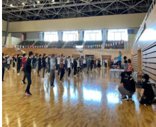
オータムフェスタと測定ブース

※3 ユトレヒト・ワーク・エンゲージメントの尺度の活力・熱意・没頭に関する設問17問(最低0点~6点で、高得点ほど良好な状態を表す)の平均点