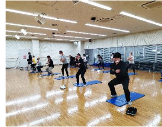
生活習慣病改善プロジェクト「健幸くらす」